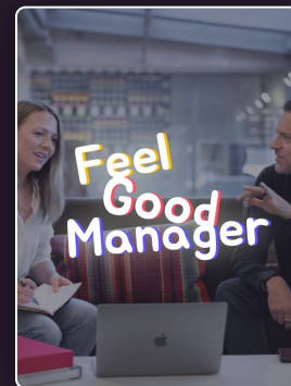
Développer sa posture managériale pour favoriser cohésion & performance