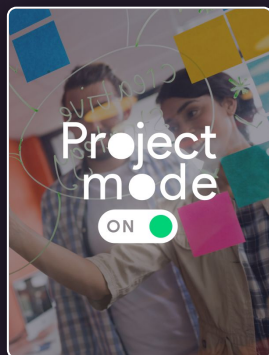
Les fondamentaux de la gestion de projet