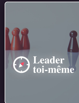
Développer son potentiel de leader