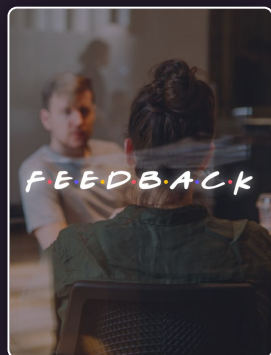
Développer la culture du feedback