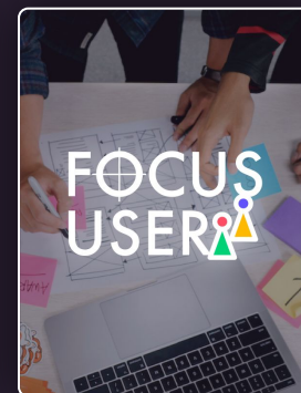
Adopter l'approche du design thinking dans ses projets.

*Cliquez sur l'image pour voir la bande annonce de la formation