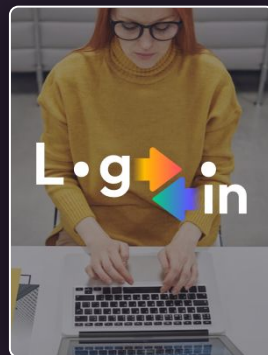
Le management dans un contexte hybride