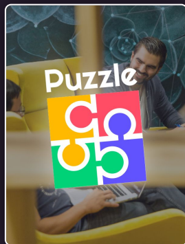
Les fondamentaux du management