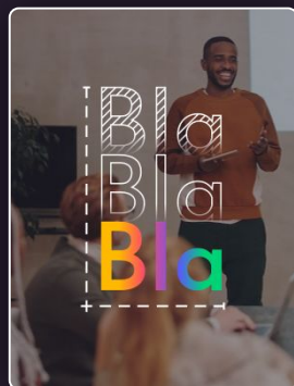
Communication & Prise de parole