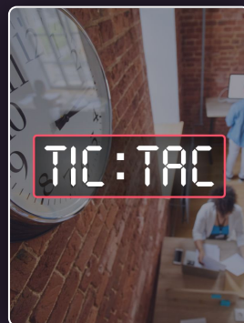
Mieux gérer son temps pour gagner en efficacité.